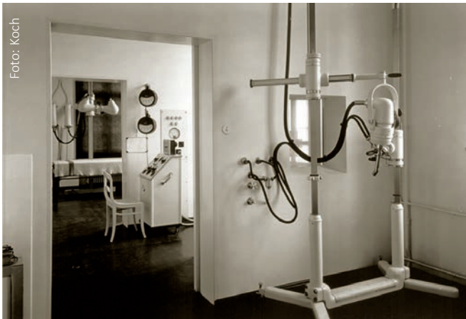
Abb. 2 (l.): Moulage eines Melanoms der Fußsohle (1922); Abb. 3 (r.): Strahlentherapiegerät 1938