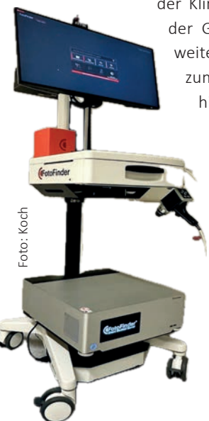
Abb. 4: FotoFinder mit Einsatz künstlicher Intelligenz