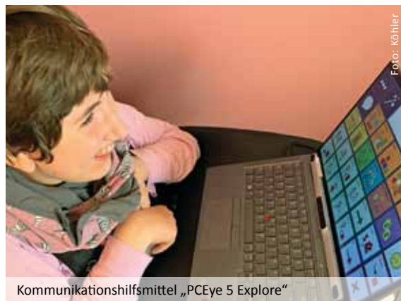
Kommunikationshilfsmittel „PCEye 5 Explore“